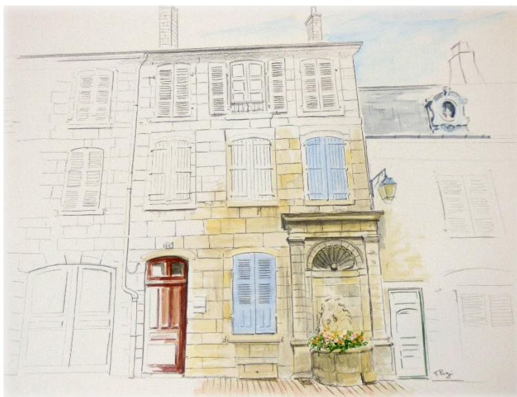
(Maison de ville 22 Grande Rue - illustrations François Pagé 2020)

Un ou plusieurs rendez-vous avec les habitants auront lieu d'ici la fin de l'année 2020.