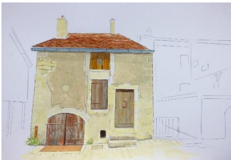
(Maison de commerçants, Grande Rue, maison de vigneron rue Pasteur – dessins François Pagé 2020)

La communauté de communes Arbois Poligny Salins s'est engagée par délibération en date du 24 octobre 2018 dans une démarche de révision de la Zone de Protection du Patrimoine Architectural Urbain et Paysager (ZPPAUP) de Poligny devenue Site Patrimonial Remarquable (SPR) depuis la loi relative à la liberté de la création, à l'architecture et au patrimoine du 7 juillet 2016.