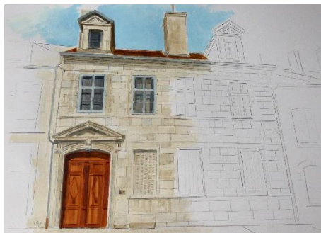
(La croix du Dan, huile sur toile, hôtel particulier 34 Grande Rue - illustrations François Pagé 2020)